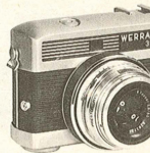
WERRA III E

Appareil de même présentation et de caractéristiques identiques au Werra I C. Mais en plus une cellule incorporée couplée au diaphragme et aux vitesses assure d'excellents résultats même aux débutants. La cellule est réglable de 6 à 400 ASA : les indications sont lisibles dans le viseur. WERRAMAT E avec TESSAR 2,8 Ø 30,5 V . Prix Photo-Hall Sac cuir « Tout Prêt » ..... 30,00