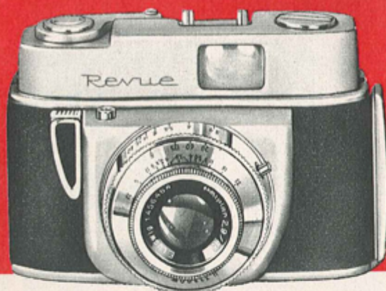
① REVUE 35 N