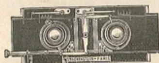
Dispositif permettant d'écartier ou de rapprocher les objectifs.

90 mm. pour les sujets se trouvant de 10 à 1000 m. ; 100 mm. pour les grands lointains ; 75 mm. pour les sujets placés de 5 à 10 m. ; 65 mm. pour les distances de 3 à 5 m. — L'écartement est obtenu par vis micrométrique double. — Points de repère très lisibles. — Diaphragmes iris se réglant automatiquement à n'importe quel écartement. — Cet appareil possède tous les avantages des stéréo-panoramiques décrites page 5 et possède l'avantage d'être monté avec l'obturateur de plaque "L'INDEREGLABLE" décrit à la page précédente. Est livré avec magasin automatique à 12 plaques, dépoli quadrillé dans son cadre, viseur stéréo-panoramique et doubles mires, déclencheur.