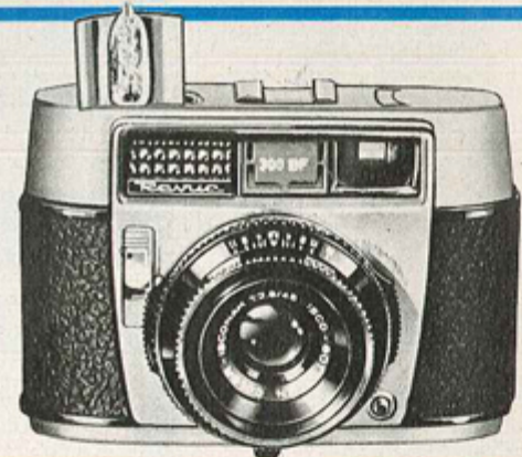
Preis- senkung! ⑥ REVUE 300 BF 129.- Anz. 13.-